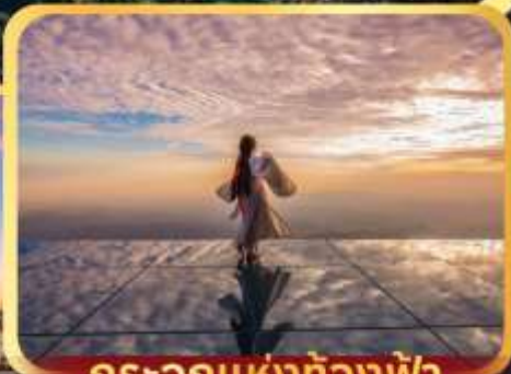
กระเจ๊กแห่งท้องฟ้า