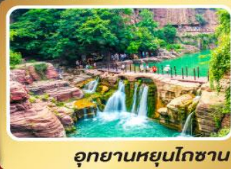
อุทยานหยุ่นโกซ่าน