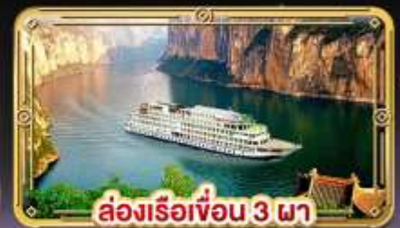
ล่องเรือขื่อน 3 วัน