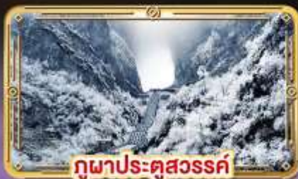
กุฎาประตูลสวรรค์