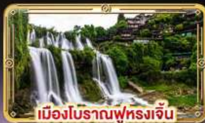
เมืองโบราณฟุหลงเจิ่น