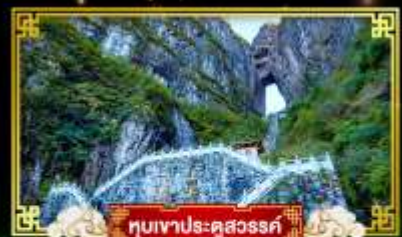
หุบเขาประตูสวรรค์