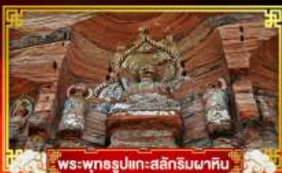
พระพุทธรูปแกะสลักหินผาศิน