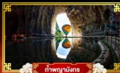
ถ้ำพญามังกร