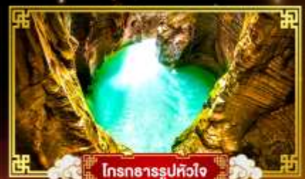
โตรถการรูปหัวใจ