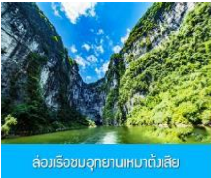
ล่องเรือชมอุทยานเหมาดังเสี๋ย