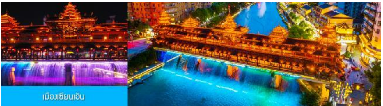
เมืองเซียนเอิน