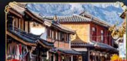
เมืองโบราณไปซา