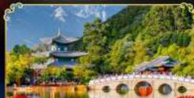
สระมิ่งกรต้า