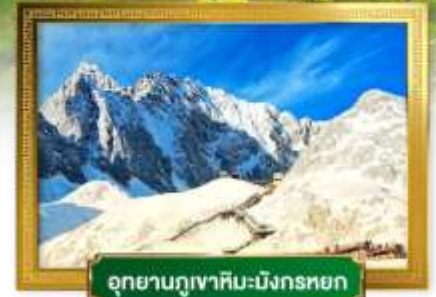
อุทยานกุเวาหิมะมังกรหยก

เดินทางโดยสายการบินโซน่าอีสเทิร์นแอร์ไลน์