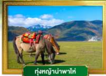
ทุ่งหญ้าป่าพาโห่