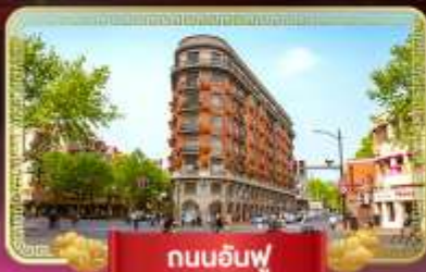
ถนนอันฟู่