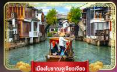
เมืองโบราณจูเจี๋ยเซียว