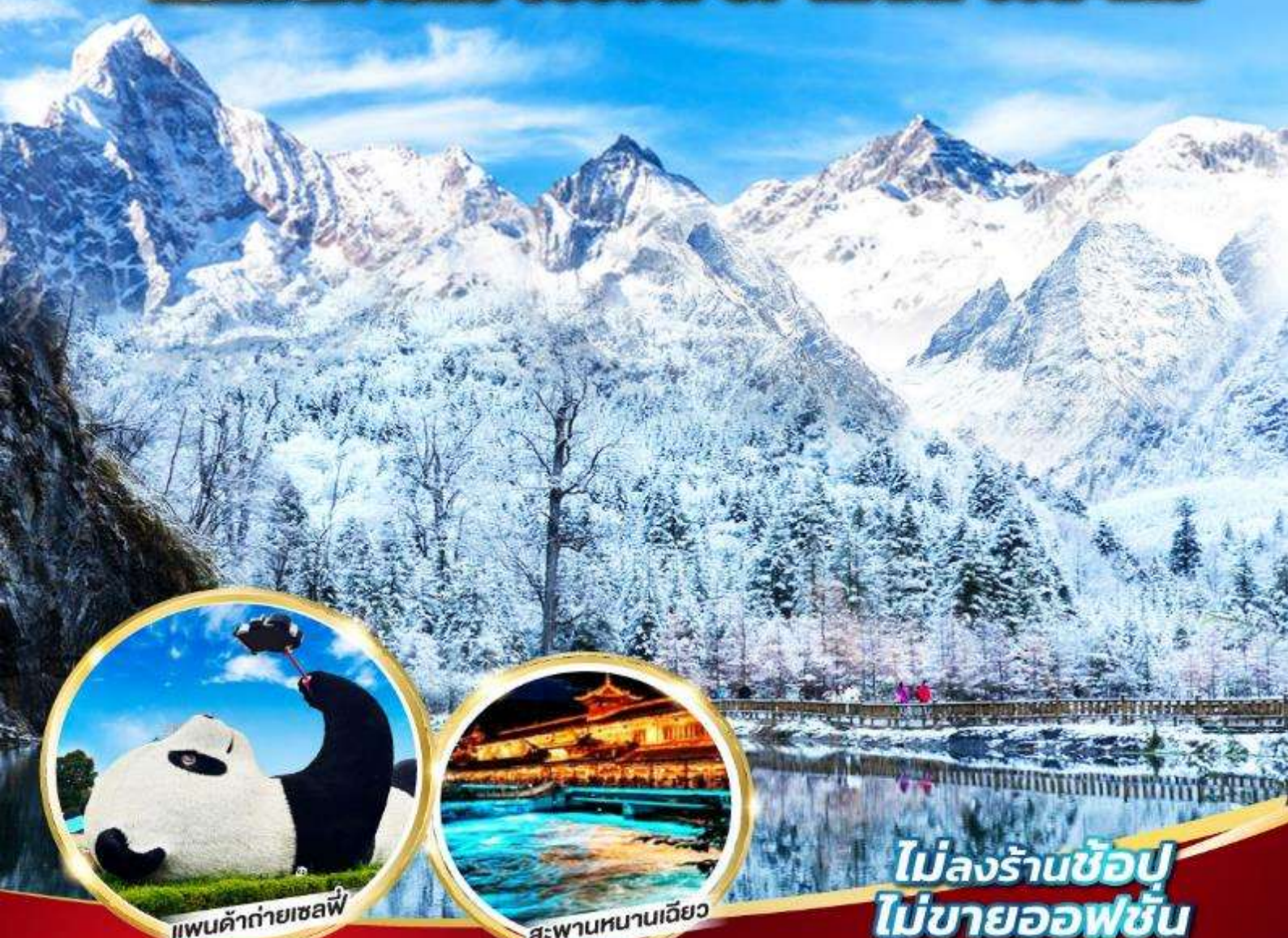
แพนด้ายักษ์เซลฟี่

หมี่แพนด้ายักษ์ ช้อปปิ้ง POP MART 5 วัน 4 คืน