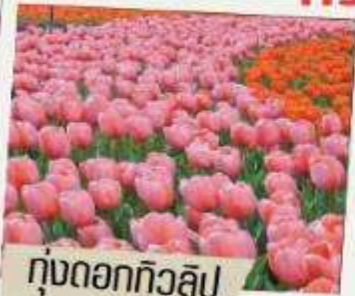
ทุ่งดอกทิวลิป