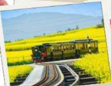
ทุ่งดอกทุ่งดอก มัสตาร์ด