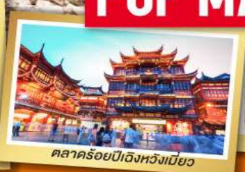
ตลาดร้อยปีอิงหวังเมี่ยว