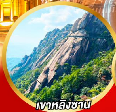
เวาหลิงซาน