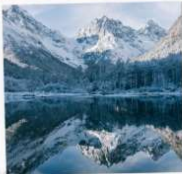
อุทยานปีศาจโกว