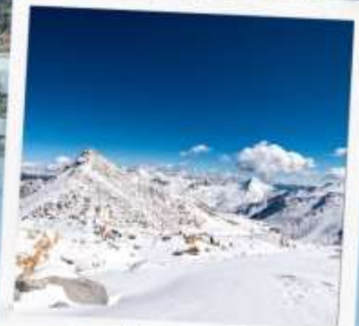
ภูเขาหิมะการ์เซีย ท่ากู่ปิงชวน