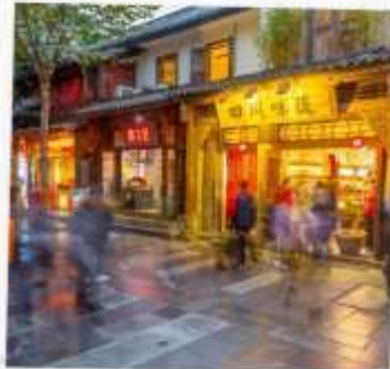
ถนนชอยกว้างแคบ