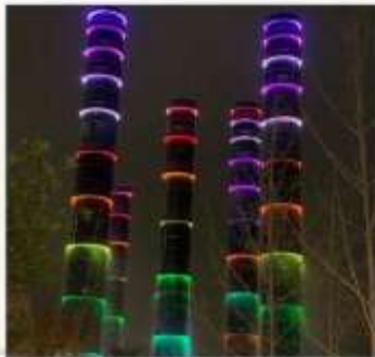
ชมแสงสีห้าง SKP