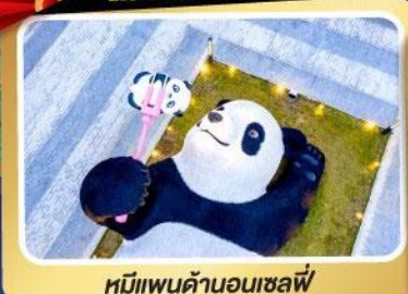
หมีแพนด้าอนเชลฟี