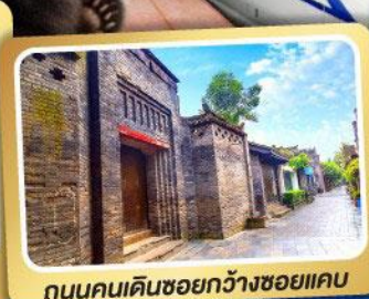
ถนนคนเดินชอยกวางชอยแคบ