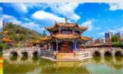
วัดหยวนทง