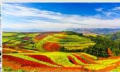
แผ่นดินสีแดง