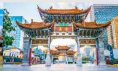
ประตูน้ำทอง โก๋หยก

*ทางบริษัทฯ ขอสงวนสิทธิ์ในการสลับโปรแกรมทัวร์ตามความเหมาะสมขึ้นอยู่กับสถานการณ์หน้างาน โดยคำนึงถึงผลประโยชน์ของลูกค้าเป็นสำคัญ