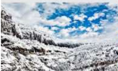
ภูเขาหิมะเจียวจื่อ