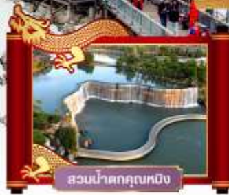
สวนน้ำตกคุนหมิง

พิเศษ! โชว์จางอวี้โกเปว "ความประทับใจลี่เจียง"