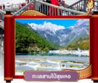
ทะเลสาบไป๋ซู่เหอ