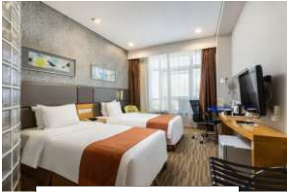
Holiday Inn Express Hotel