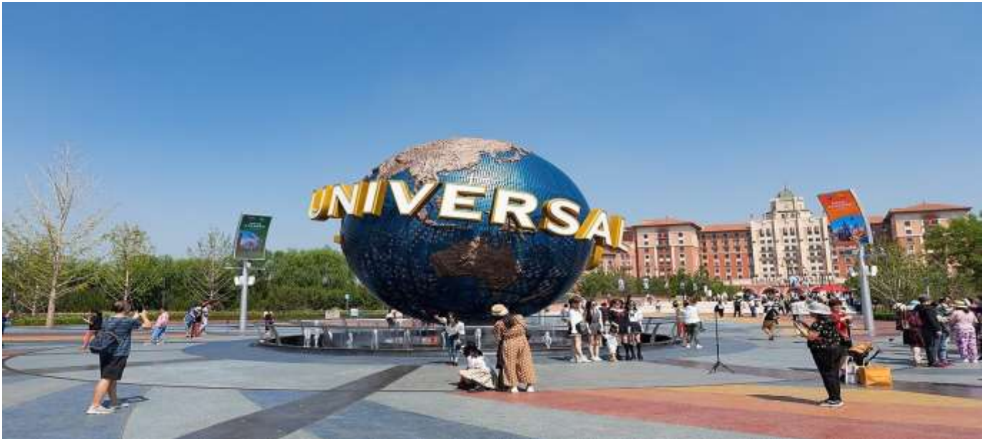
ที่พัก Leafin HOTEL BEIJING หรือเทียบเท่า