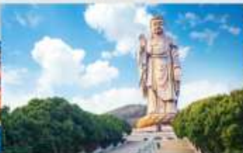
พระใหญ่หลิงชานต้าฝอ