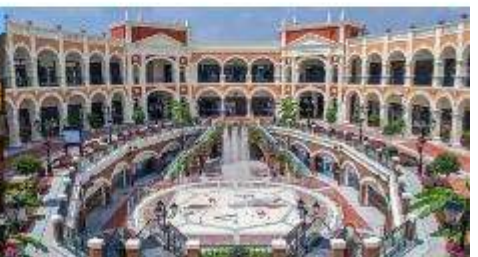
Florentia Village Outlet

*ทางบริษัทฯ ขอสงวนสิทธิ์ในการสลับโปรแกรมทัวร์ตามความเหมาะสมขึ้นอยู่กับสถานการณ์หน้างาน โดยค่านี้จึงแสดงผลประโยชน์ของลูกค้าเป็นสำคัญ