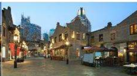
ย่านซินเทียนตี้