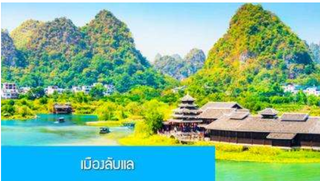
เมืองลิบแล