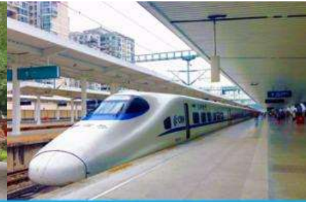
นั่งรถไฟความเร็วสูง