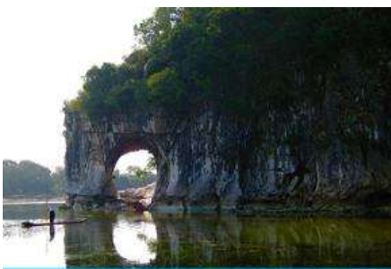
เขาวงช้าง

พักที่ GUILIN VIENNA HOTEL โรงแรมระดับ 4 ดาวท้องถิ่น หรือเทียบเท่าในเมืองกุ้ยหลิน