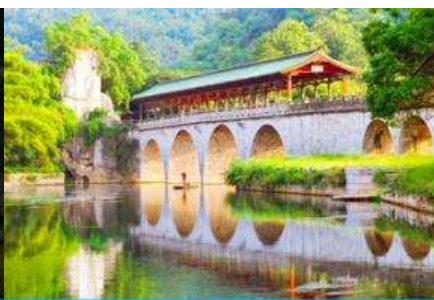
สวนเจ็ดดาว