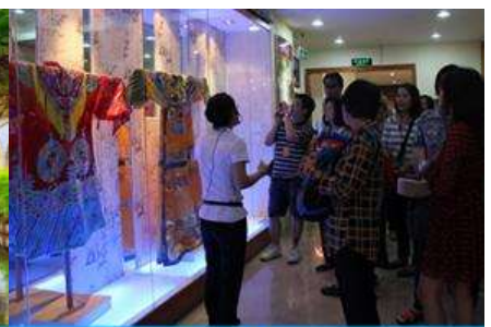
ร้านผ้าไหม

16/4 เมืองกุ้ยหลิน –เขาวงช้าง-ศูนย์จำหน่ายผ้าไหม-สวนเจ็ดดาว-เขาลูจู่-วัดซีเสี่ย-ศูนย์จำหน่ายหยก-ชั้นรถไฟความเร็วสูงสู่เมืองหนานหนิง