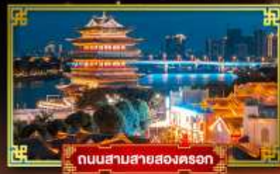
ถนนสายสองนครก