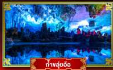
ทางลุยฮือ

"ดินแดนแห่งสายน้ำและขุนเขา" สัมผัสประสบการณ์นั่งบอลลูนชมวิวนุ่มสูง