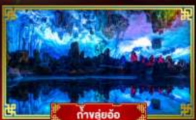
ถ้ำสวยอ้อ

"ดินแดนแห่งสายน้ำและขุนเขา" สัมผัสประสบการณ์นั่งบอลลูนชมวิวมุมสูง