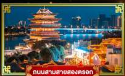
ถนนสามสายสองตอรอก