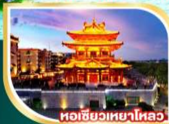
หอชิวเหยาไหล