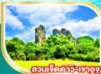
สวนเจ็ดดาว-เงาอู๋