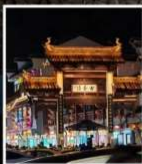
ฟูจื่อเมี่ยว