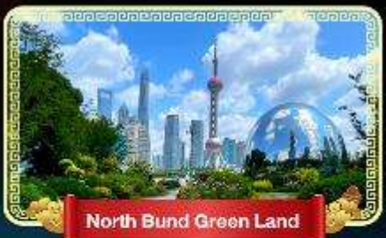
North Bund Green Land