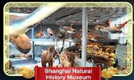
Shanghai Natural History Museum