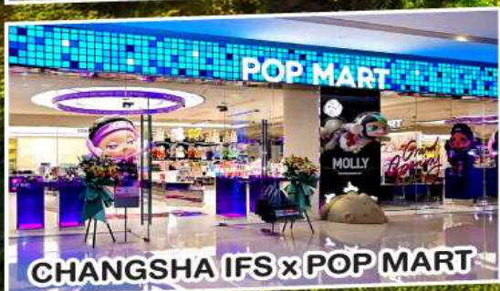
CHANGSHA IFS x POP MART