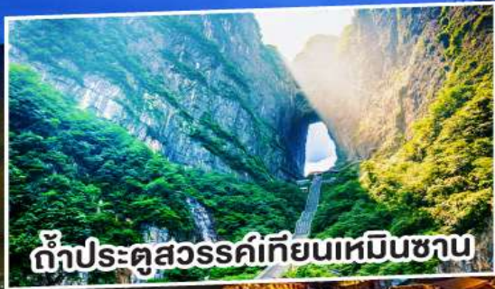
ถ้าประตูสวรรค์เทียนเหมินชาน