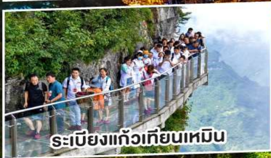
ระเบียงแก้วเทียนเหมิน