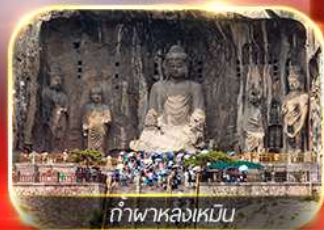
กำแพงหล่งเหมิน