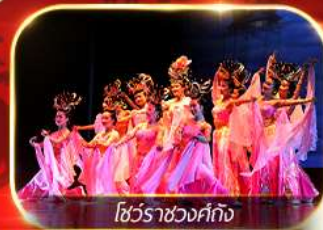
โชว์ราชวงศ์ก๊ก

สัมผัสความยิ่งใหญ่อลังการกองทัพจีนสี่ฮ่องเต้ นั่งรถไฟความเร็วสูงทะลุเมืองโบราณ ย้อนตำนานประวัติศาสตร์จีน