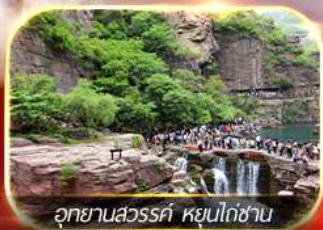
อุทยานสวรรค์ หุ่นโก่ซาน