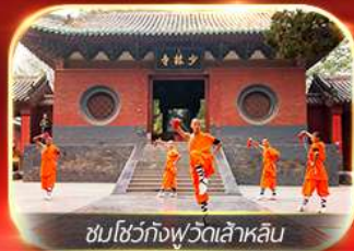
ชมโชว์กังฟูวัดเล้าหลิน