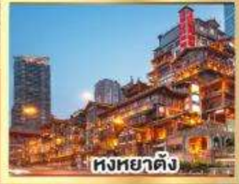
หงหยาดิ่ง