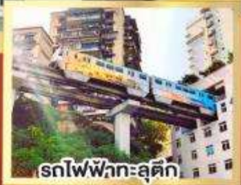
รถไฟฟ้ากะสุติ๊ก