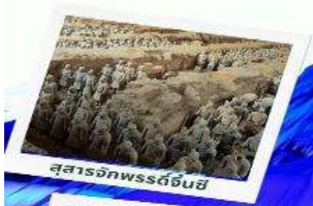
สุสานจักรพรรดิฉินซี