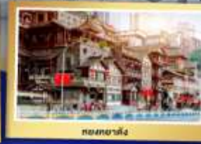
ถนนฉางชิ่ง