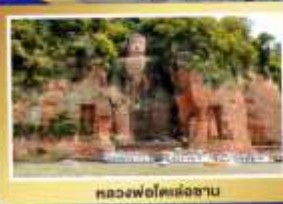
หลวงพ่อดเล่อซาน