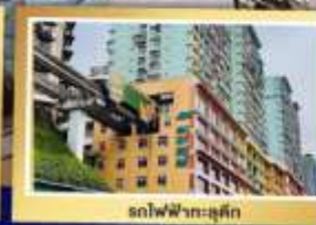
รถไฟฟ้ากระสุน