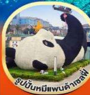
รูปปั้นหมีแพนด้าเซฟี่