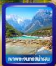
เขาวงพระจันทร์ลี่เจียง