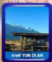
ศาลา YUN DI AN

เมืองโบราณซูเหอ • สะพานگردา • ร้านกาแฟ YUN DI AN หมู่บ้านปิงชา • บึงกระเช้าภูเขาผิงกรหยก • หมู่เขาวงพระจันทร์ลี่เจียง ชมการแสดง Impression of Lijiang • เมืองโบราณลี่เจียง