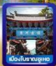
เมืองโบราณซูเหอ