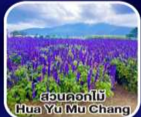
สวนดอกไม้ Hua Yu Mu Chang