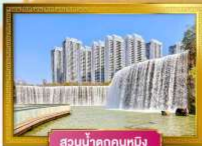
สวนน้ำตกคุนหมิง