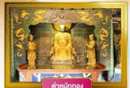
ตำหนักทอง