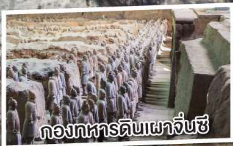
กองทหารดินเผาจีนซี