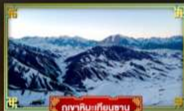
ภูเขาเทียนชาน