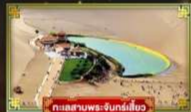
ทะเลสาบพระจันทร์เสี้ยว