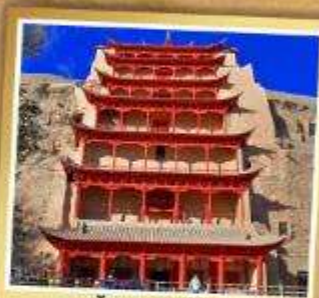
ต้าเถะสลักม่อเกา