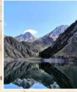
ทะเลสาบเทียนฉือ