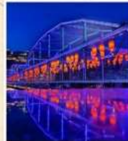
สะพานหวงเหอ ตี้อี้เจียว