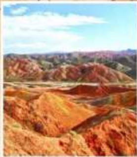
ภูเขาสายรุ้งต้นเซีย