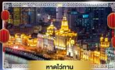
หาดวี้ถ่าน