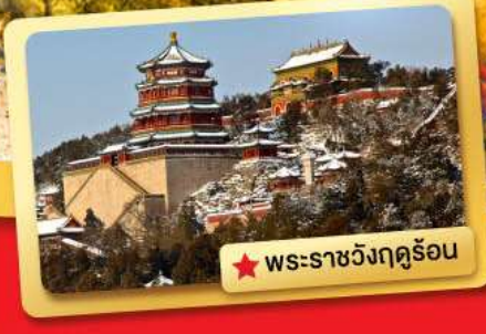
★ พระราชวังฤดูร้อน