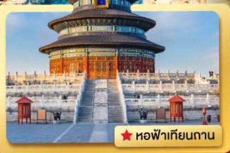
★ หอฟ้าเทียนถาน

เที่ยวเมืองหลวงของประเทศจีน.. ชมประวัติศาสตร์ที่ยิ่งใหญ่ พบกับ..อารยธรรมเก่า.. ความเจริญของยุคปัจจุบัน.. ที่ผสมผสานกันอย่างลงตัว