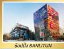
ช้อปปิ้ง SANLITUN