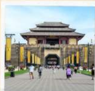
โรงถ่ายภาพยนตร์ ชิงหมิงช่างเหอถู่