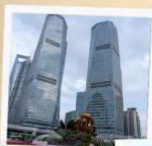
ย่านลู่เจียจู่