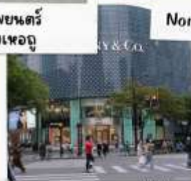
ถนนคนเดินหวยไห่