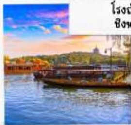
ล่องเรือทะเลสาบซีหู