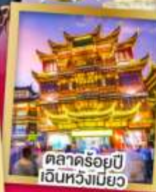
ตลาดร้อยปีเงินหวังเมียว