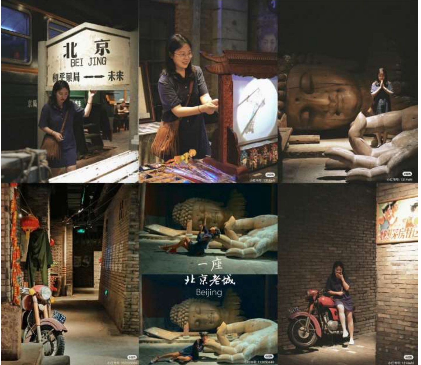
ขอบคุณเจ้าของภาพ (เครดิตตามภาพ)