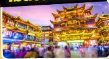
ตลาดร้อยปีเจิ้งหวงเหมียว