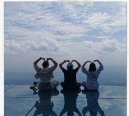
กระจกแห่งท้องฟ้า