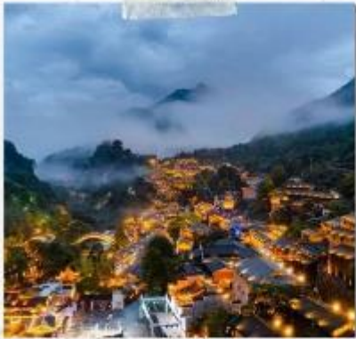
หุบเขาวังเซียนกู่