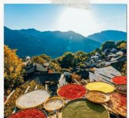
หมู่บ้านหวงลิ่ง