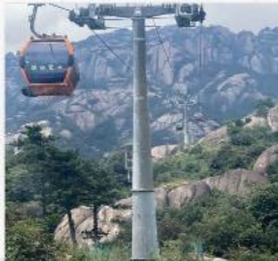
เขาลิ่งซาน