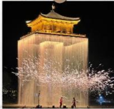
แสงไฟอุ๋นวิโจว