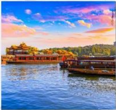
ทะเลสาบซีหู