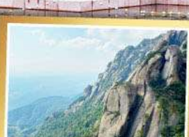
เขาหลงซาน