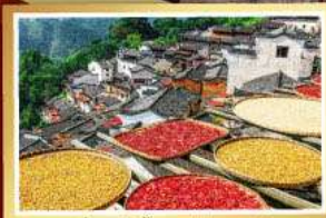
หมู่บ้านชานชานหมู่บ้านหวงหลิง