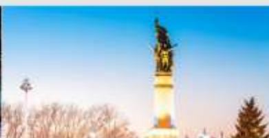
อนุสาวรีย์ผึ้งหง